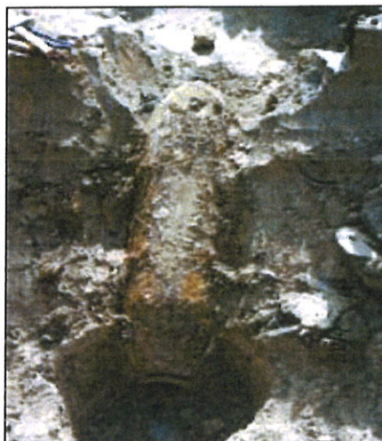
Abb. 1. Fliegerbombe, angetroffen bei Bauarbeiten in der Nähe einer Tankstelle

Daher werden Bauvorhaben immer wieder durch Kampfmittelfunde, ja sogar auch „Explosionen von Kampfmitteln“ gestoppt (Abb. 2).