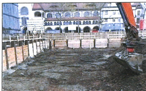
Abb. 4. Schichtenweiser Abtrag, verpflichtend bei baubegleitender KMR

Im Gegensatz zur "Bauaushubüberwachung" sind die Vorgehensweisen der "baubegleitenden Kampfmittelräumung" exakt beschrieben und definiert im Abschnitt 3 der Arbeitshilfen Kampfmittelräumung - AH-Kampfmittelräumung des Bundes [3]. Folgende Zitate aus diesem Abschnitt der AH-Kampfmittelräumung sprechen für sich und bedürfen keiner weiterer Kommentierung, besonders wichtige Passagen aber in Fettdruck hervorgehoben: