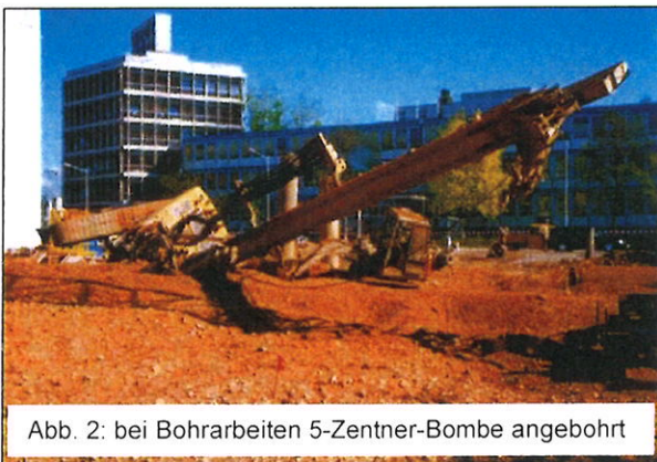
Abb. 2: bei Bohrarbeiten 5-Zentner-Bombe angebohrt

Daher werden Bauvorhaben immer wieder durch Kampfmittelfunde, ja sogar auch „Explosionen von Kampfmitteln“ gestoppt (Abb. 2).